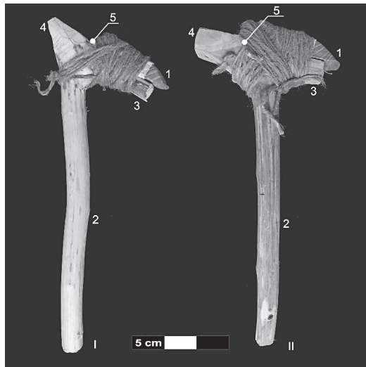
Slika 1. Varijante vezivanja tesli za dršku: 1 – sečivo, 2 – osovina, 3 – prst, 4 – peta, 5 – rame / poprečni rez.

S obzirom na to da drške u vinčanskoj kulturi nisu pronađene, izabrali smo ih na osnovu podataka pronađenih u literaturi. Različiti tipovi ove vrste artefakata zabeleženi su u etnoarheološkim istraživanjima, gde je podela izvršena na osnovu morfologije, odnosno položaja u kojima se nalaze elementi drške kao i vrste aranžmana (Rangi Hiroa 1930). Prilikom izbora varijanti posmatrano je koji su delovi prisutni na drškama i da li su njihove funkcije pogodne za primenu vezanog aranžmana koji je odabran za realizaciju eksperimenta. Aranžman je odabran na osnovu kriterijuma bezbednosti pri korišćenju i jednostavnosti izrade i primenjen je na oba tipa drški. Oba modela izrađena su od hrasta, koji se odlikuje tvrdoćom i elastičnošću, što omogućava veliku izdržljivost i apsorbovanje udaraca (Janković et al. 1984: 113). Drške su izrađene savremenim alatima, što nije od značaja za sam eksperiment. Osnovna razlika između izabranih varijanti sastoji se u položaju u kojem se nalaze tesle u odnosu na osovinu drške. Kod varijante I je prst postavljen pod ostrim uglom (60 stepeni), dok je kod varijante II postavljen pod gotovo pravim uglom (80 stepeni) u odnosu na osovinu (slika 1). Prva varijanta odlikuje se petom koja gradi tup ugao sa osovinom, dok je kod druge taj