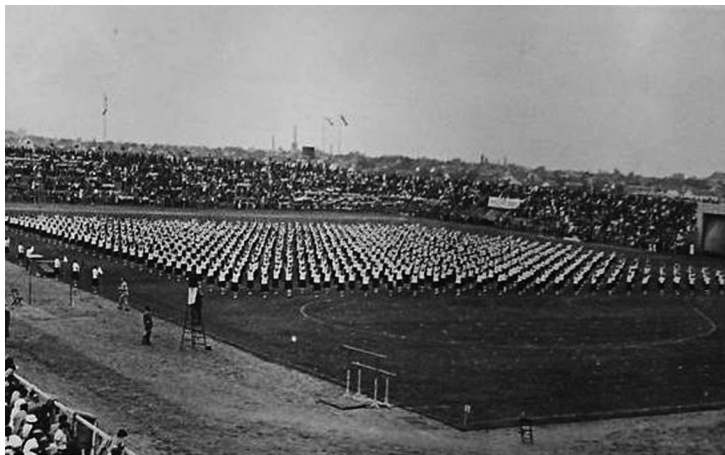
Slika 3. Sokolska vežba tokom sleta na Stadionu kralja Petra II