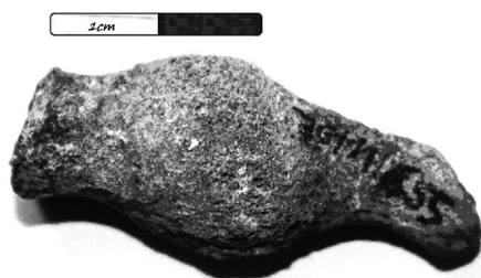
Slika 6. Patološka promena u vidu zaraslog preloma na metakarpalnoj kosti svinje