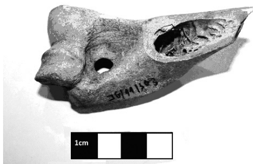
Slika 3. Distalna epifiza levog humera svinje sa tragom kasapljenja u vidu poprečnog, punog preseka distalnog dela dijafize

Figure 2. Left Sus sp. scapula with traces of butchery