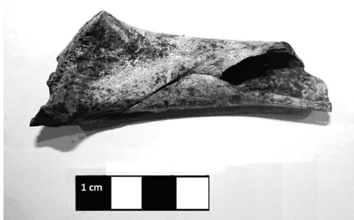
Slika 5. Na distalnom delu dijafize i epifize desnog radijusa Ovis/Capra na posteriornoj strani konstatovan poprečni dublji urez

Figure 4. Proximal part of right Ovis/Capra radius with long and wide incision on the anterior side of the bone, on the medial part of the diaphysis