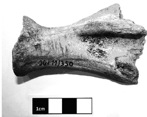
Slika 2. Leva skapula svinje sa tragovima kasapljenja u vidu nekoliko manjih, plitkih paralelnih ureza na anteriornoj strani kosti, na medijalnom delu spine

Figure 2. Left Sus sp. scapula with traces of butchery