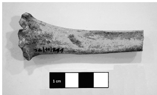
Slika 4. Proksimalni deo (2/3) desnog radijusa Ovis/Capra sa dužim i širim urezom na anteriornoj strani kosti, na medijalnom delu dijafize

Većina analiziranih kostiju je fragmentovana, a više su zastupljeni stari nego recentni prelomi. Od