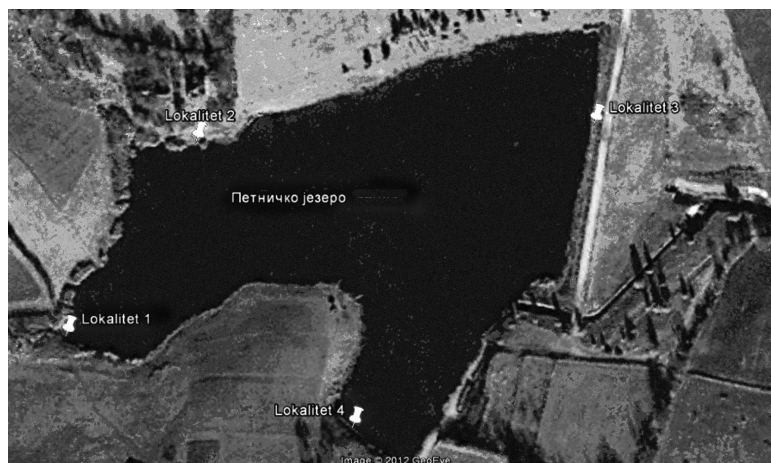
Slika 1. Petničko jezero sa lokalitetima na kojima je vršeno uzorkovanje