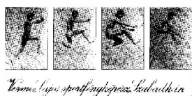
Vermeš Lajos sportfényképezés budapesti éra