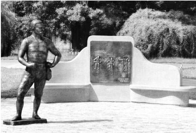
Slika 4. Spomenik Lajošu Vermešu na mestu održavanja prvih igara