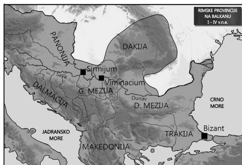
Slika 1. Rimske provincije na Balkanu

rikum i Panonija, na jugu Trakijom i Makedonijom, a na severu Dunavom, odnosno Dakijom. U vreme rimskog cara Domicijana (81-96. g. n. e.) Mezija je podeljena na Gornju, današnja istočna i južna Srbija, i Donju, današnja severna Bugarska (slika 1). Granica između ova dva dela bila je reka Kiabros, današnja Cibrica (Mirković 1968: 9).