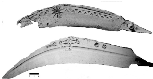
Slika 3. Zakrivljena sečiva nađena u ratničkim grobovima

Figure 3. Curved metal blades found in the graves of warriors