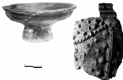
Slika 4. Fragmenti nađene dačke keramike

ovim grobovima bili pripadnici iste društvene strukture kao stanovništvo sa prostora Dakije. To bi naročito moglo da važi za pokojnike sa nekropole Lepena kod Karaule iz Boljetina, s obzirom na njihovu relativnu blizinu samoj Dakiji (slika 2). Međutim, samo prisustvo dačkog materijala kao dominantnog grobnog priloga i istovetan način sahranjivanja pokojnika sa načinom sahranjivanja na analognim lokalitetima u Dakiji nisu dovoljni pokazatelji koji bi ovo potvrdili. Takođe, treba napomenuti i to da je do sada pronađeno relativno malo ovakvih nekropola na teritoriji Gornje Mezije, da bi se moglo govoriti o nekoj dugotrajnijoj praksi i eventualnoj zajednici dačkog življa na ovom prostoru. U slučaju kad bi se utvrdilo da je takva neka zajednica i postojala, otvorio bi se niz pitanja o njenom nastanku i odnosu sa skordističkim i rimskim stanovništvom.