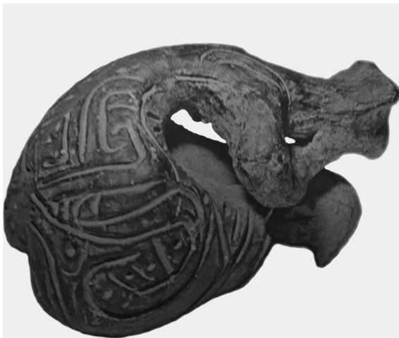
Slika 1 Figurina u sedećem stavu (preuzeto: Katunar 1988)