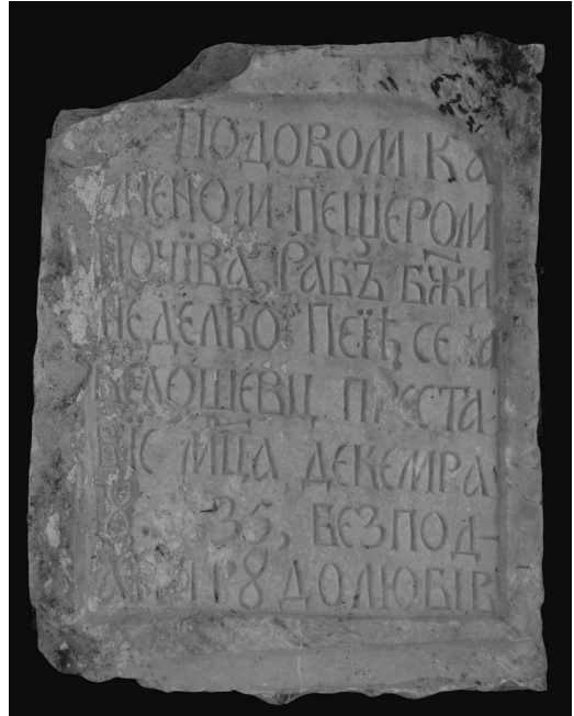
Slika 4. Jedan od najočuvanijih spomenika – prednja strana