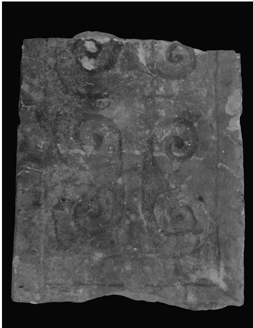
Slika 5. Jedan od najočuvanijih spomenika – zadnja strana