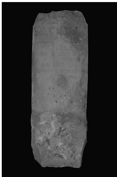
Slika 2. Jedan od najmlađih spomenika iz 1878. godine

Na skoro polovini, tačnije 181 pronađenom fragmentu, konstatovani su ornamenti. Oni su uklesivani u plitkom reljefu, što je zastupljeno na