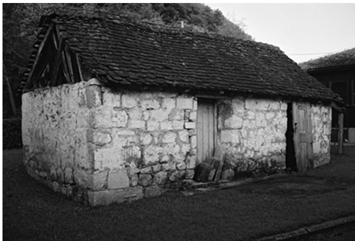
Figure 1. Auxiliary building before ruining

analizi korišćeni su antropogeografski rezultati istraživanja Ljubomira Pavlovića na području Kolubare i Podgorine.