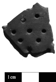
Slika 2. Fragmenat cediljke

Figure 2. Fragment of cullender