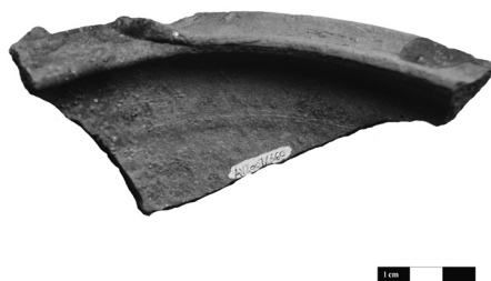
Slika 4. Fragmenat mortarijuma sa izlivenikom

Figure 2. Fragment of cullender