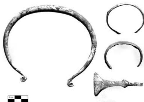
Slika 2. Pokretni nalazi sa lokaliteta Savinac

Pored ovih metalnih predmeta na lokalitetima Branković, Gosinja planina i Križevac (glasilačka kulturna grupa), kao i na području zapadne Srbije, beležimo i postojanje narukvica, ogrlica, perli, ukrasnih kopči, grivni i naočaraste fibule. Na lokalitetima Kriva Reka kod Čajetine i Ražani kod Kosjerića beležimo nakit zastupljen sa nekoliko tipova fibula (od kojih je najpoznatija naočarasta fibula), kopči, privezaka, grivni i pinceta. Pinceta za-beležena u Krivoj Reci je od bronzne i datovana je u period glasilačke kulture gvozdenog doba, konkretnije u fazu IVb (Zotović 1985: 72). Na lokalitetu Po-