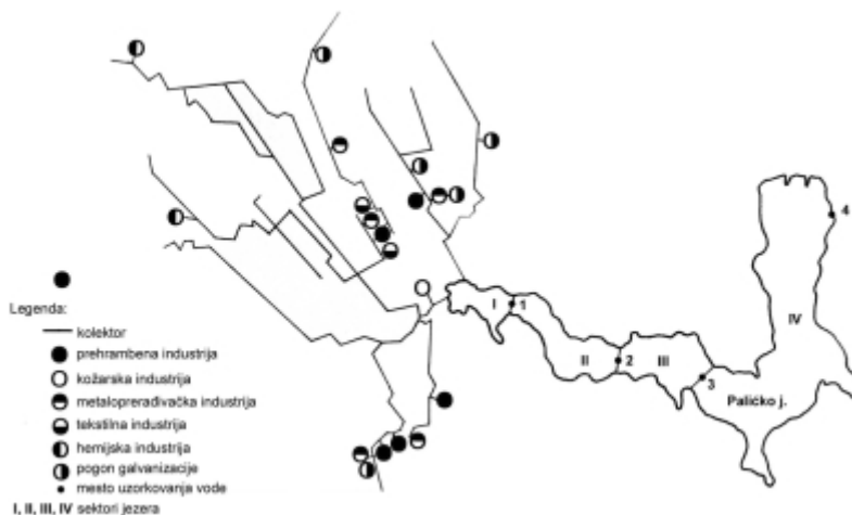
Slika 2. Skica jezera sa prikazom položaja industrija koje svoje otpadne vode ispuštaju u Palić