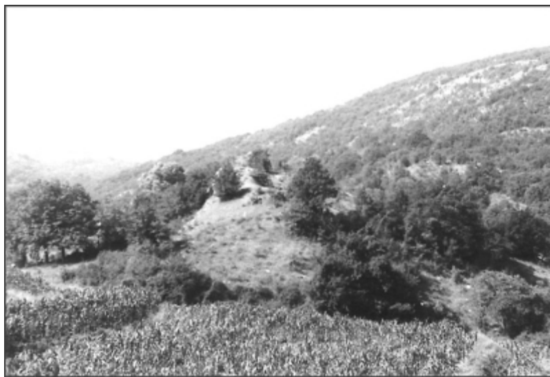
Slika 1. Lokalitet Gradac

nagiba terena i čestih jakih padavina. Vegetacija je vrlo oskudna usled spiranja tla i nedostatka plodnog zemljišta. Čitavom teritorijom dominira uzvišenje Gradac kao najizraženiji oblik reljefa. Lokalitet je najpristupačniji sa severoistočne i istočne strane gde zaravnjeni plato u podnožju polako prelazi u uzvišenje (slika 1). Sa suprotne, jugozapadne strane je pristup otežan zbog strmog terena i potoka Banjice.